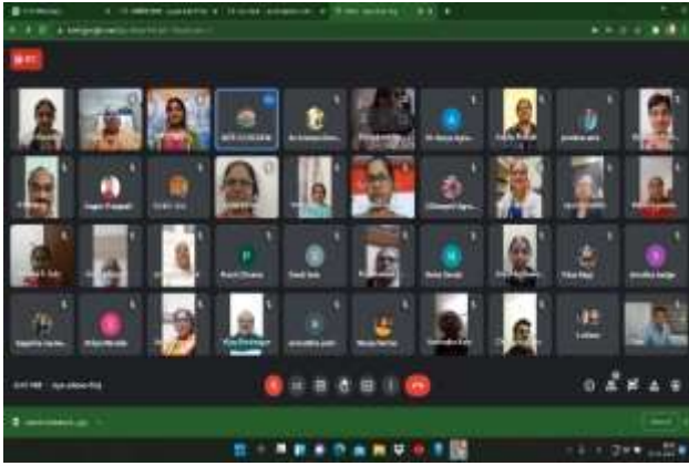
स्वामिविवेकानन्दजयन्त्युत्सवः - १२-०१-२०२२