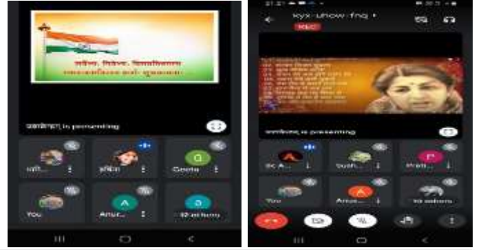
गणतन्त्रदिनोत्सवः सुरसम्राज्ञ्याः भारतरत्नस्य लतायाः श्रद्धाञ्जलिकार्यक्रमश्च