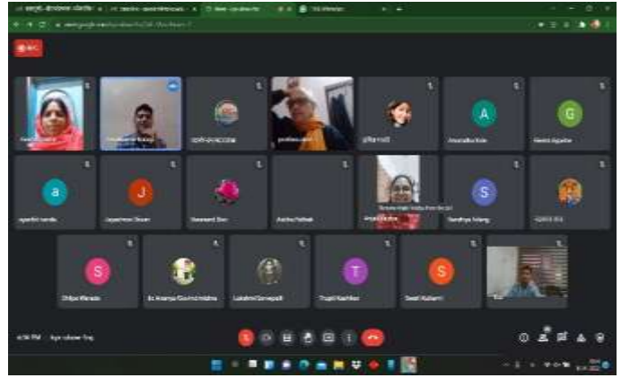
संस्कृतसङ्गोष्ठी - ०२-०२-२०२२