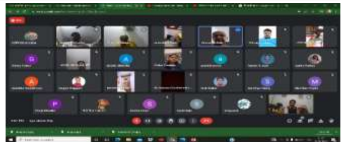
केन्द्रे प्रथमदीक्षां दीक्षां द्वितीयदीक्षां च अधियानाः छात्राः