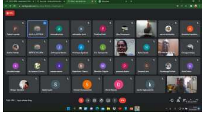
केन्द्रस्य उद्घाटनकार्यक्रमस्य दृश्यम् - २०-१२-२०२१